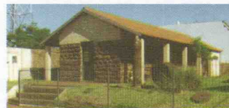
MUSEU MONSENHOR ESTANISLAU WOLSKI